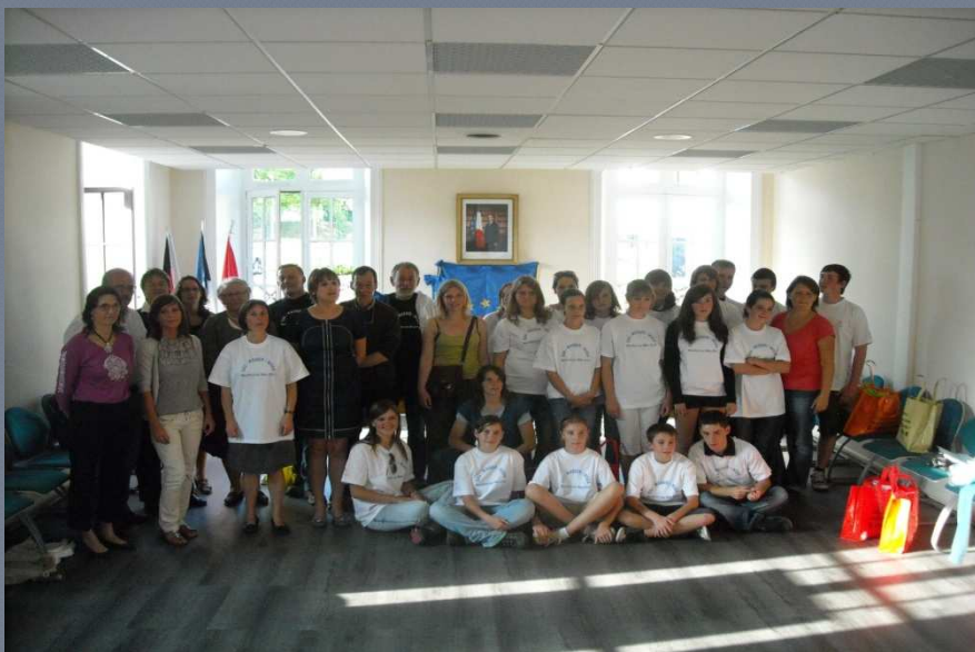
Spotkanie uczestników z władzami Montfort