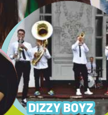
DIZZY BOYZ BRASS BAND