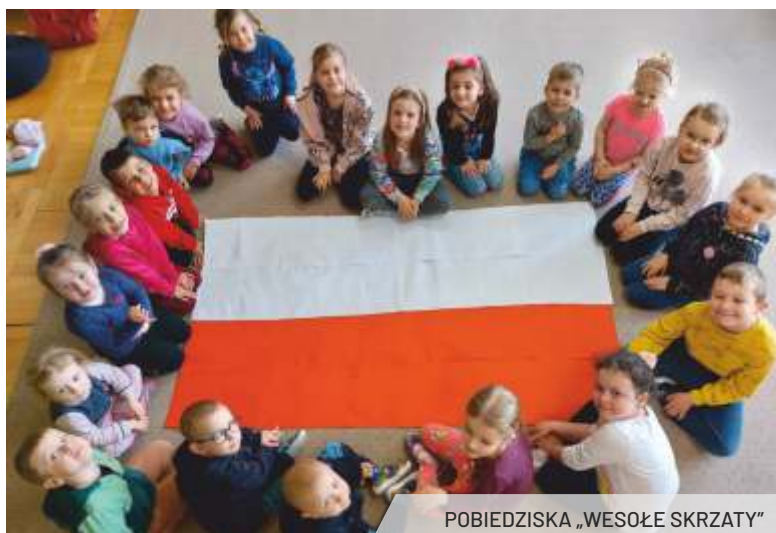
POBIEDZISKA „WESOŁE SKRZATY”