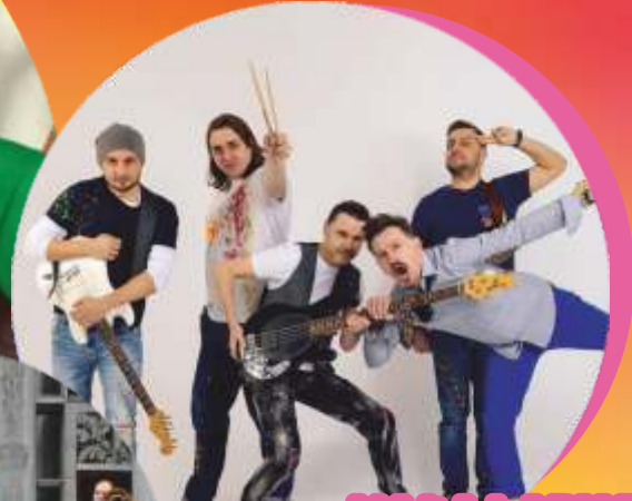
MAŁA LADY P.