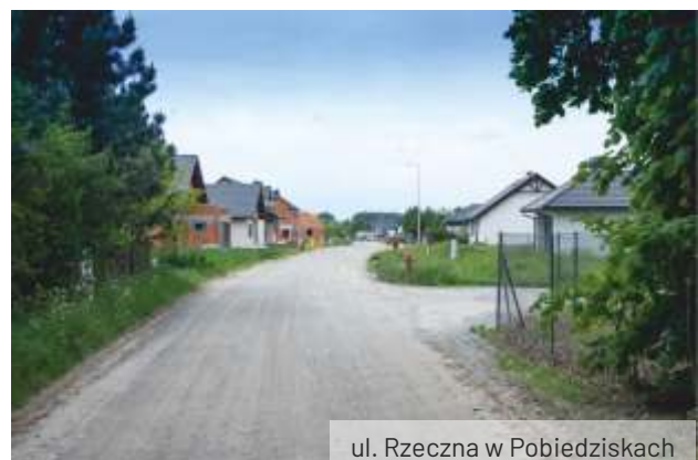
ul. Rzeczna w Pobiedziskach

Dokumentacja projektowa ul. Brzozowej w Pobiedziskach Letnisku wraz z wnioskiem o pozwolenie na budowę została złożona w Starostwie dnia 08.09.2023r. Uzgodnienia dokumentacji projektowej obejmującej ulice: Rzeczną w Pobiedziskach, Cichą, Kwiatową i Różaną w Biskupicach i Jeziorną w Jerzykowie dobiegają końca. Równolegle trwają prace projektowe dla pozostałych ulic.